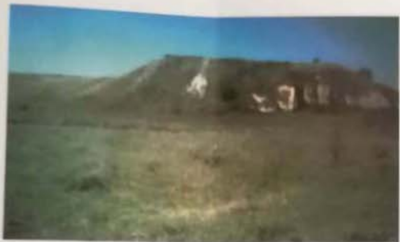
Dealul Jidovar de lângă Oreșat

Platoul pe care s-au efectuat săpăturile arheologice la Jidovar