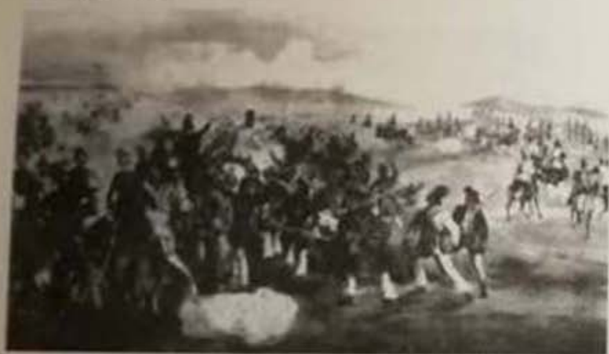
Lupta din Alibunar la 12. decembrie 1848, sub comanda lui Ianoș Damianovici, contra sârbilor în Ungaria de sud.

Preoții pe timpuri erau aproape unici intelectuali și în localitățile în care nu aveau dascăli învățau copiii să scrie, să citească, să socotească.