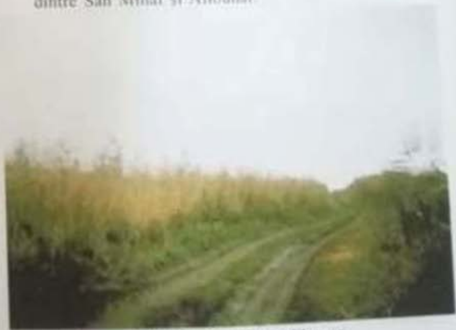
Valul lui Traian la Alibunar

Un astfel de val de apărare, la noi în Banatul sărbesc, merge de la râul Bega până la Cătaș, altul de la Alibunar, care se vede până astăzi în hotarul dintre Sîn Mihai și Alibunar.