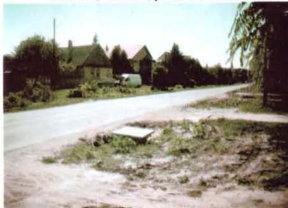
Casa lui Paia Novac, pe Valul lui Traian