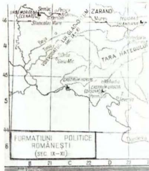
37. Voievodatul bănățean în sec. IX-XI

Împăratul Decius (249 – 251) se apăra de