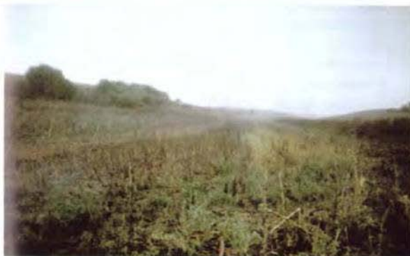
Valea afundă, între Dobrița și Padina

Nu pot ca să nu destăinuiesc tot ce știu și am văzut. Într-un film sovietic de pe vremea când eram elev la liceul român din Vârșeț, în care îi arăta pe soldații români din Războiul II Mondial, în Rusia ca pe niște hoți de găini, ceea ce știm sigur e că rușii ne-au furat Cloșca cu tot cu puii de aur. Or fi or nu românii hoți, dar cum au ajuns acești hoți români la Stalingrad, pe când ceilalți, finlandezii împreună cu germanii, ungurii stăte-au în fața Moscovei, fără să înainteze deloc.