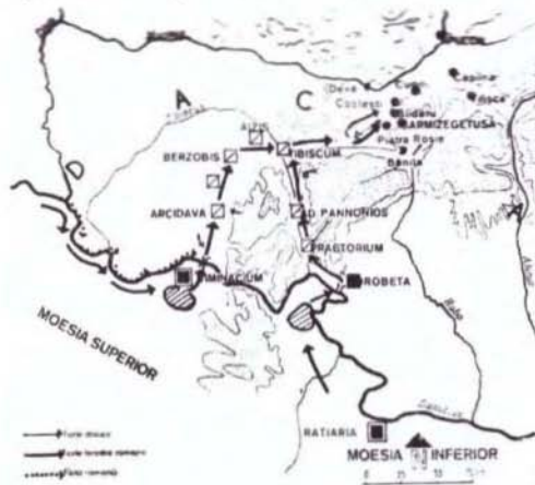
Harta privind prima campanie din anii 101 - 102

Înainte de prima și a doua ciocnire de la Tapae a fost lupta de la Turnul Roșu în care