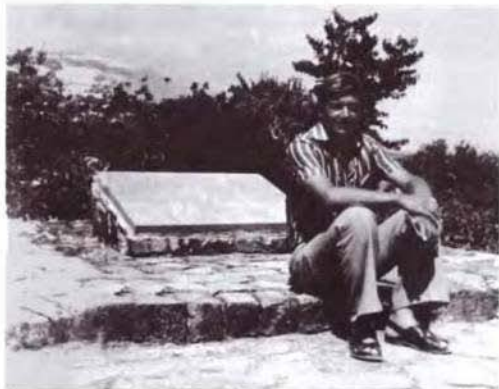
Termopile – mormântul Împ. Leonida

Vitalian a fost chemat cu înșelăciune la Constantinopol și ucis. După moartea lui imperiul indigenilor „cu căciuli și boi mulți”, romanici creștini vechi romani, se destramă. Romeii „bizantini grecizați” îi împrăștie până în Elada, pe râul Savos (Sava), chiar și până pe muntele Sinai