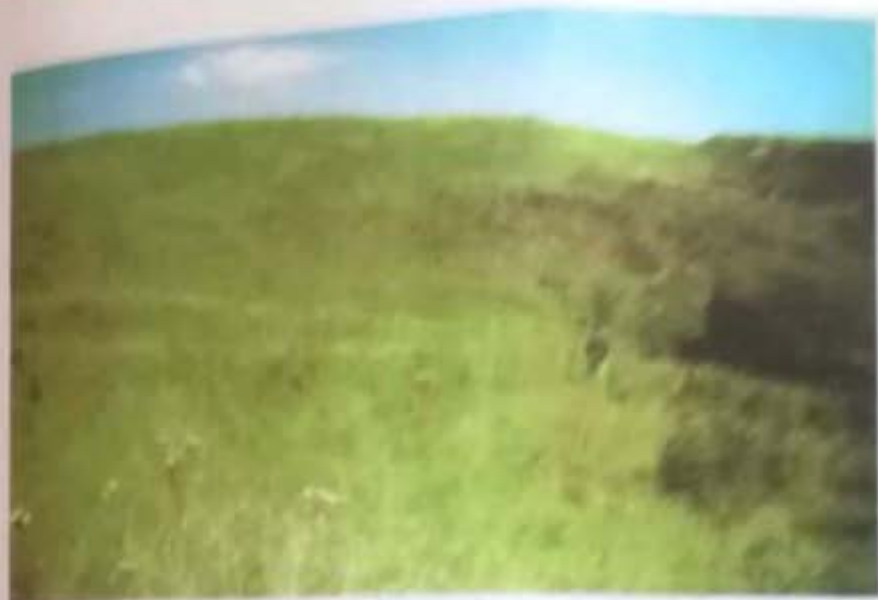
Vedere generală a împrejurimii Jidovarului