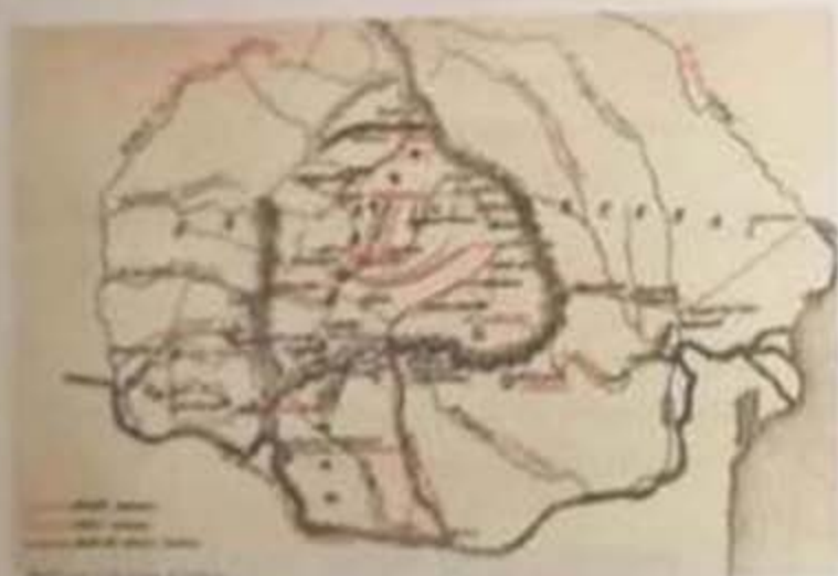
Harta drumurilor și valurilor daciei romane Șosele romane Valuri romane Hotarele Daciei Traiane